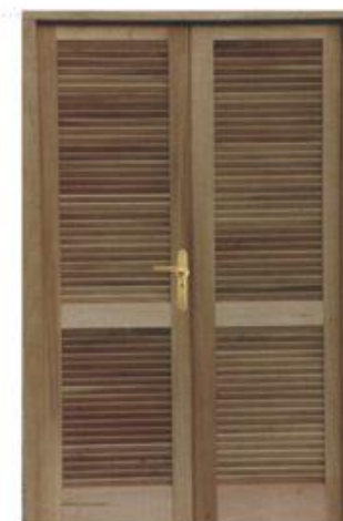
▶ Celosía 1,50 x 2,00 mts. | Vista Interior