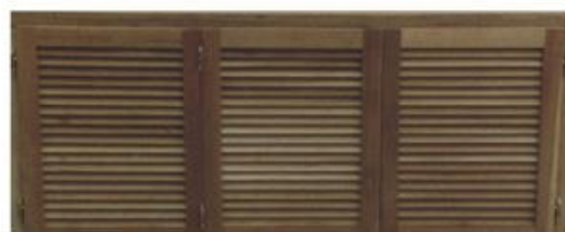
▶ Celosía 1,80 x 0,80 mts. | Vista Exterior