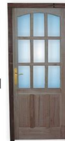
▶ Mod. 474