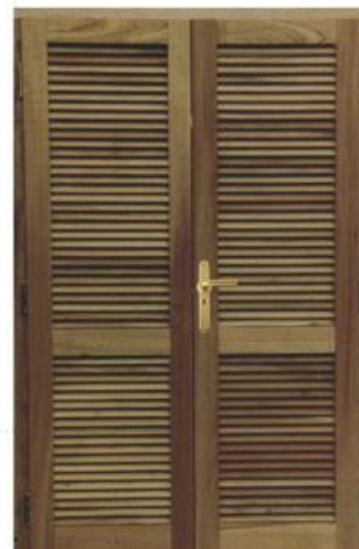
▶ Celosía 1,50 x 2,00 mts. | Vista Exterior

Idénticos a las ventanas pero con falleba de arrimar bronceada con empuñadura a palanca o volcable bronceados, o cerradura de seguridad doble paleta en el caso de las de 2 mts.