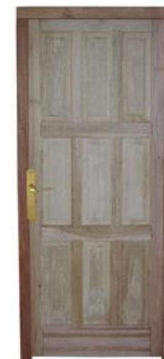
▶ Mod. 370