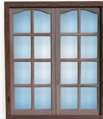
▶ Ventana de 1,50 x 2,00 mts. | Vidrio repartido C.P.I.