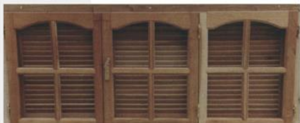
▶ Ventana 1,80 x 0,80 mts. con celosía | Vista Interior

Realizadas de la misma manera que las ventanas con tabillas de 40 mm. de ancho por 10mm. De espesor, con los cantos redondeados.